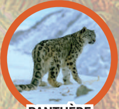
PANTHÈRE DES NEIGES