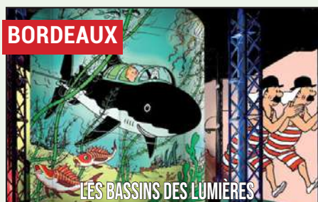
TINTIN : L'AVENTURE IMMERSIVE

Expérience immersive qui met à l'honneur le célèbre reporter à la houppette. Cette exposition, conçue et pensée pour petits et grands, nous propose de revivre les péripéties du personnage et de ses confrères à travers le monde.