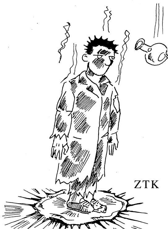
P0210 remplaçant un P1315