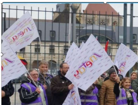
Rectorat, Poitiers décembre 2023

Syndicat National avec le relai de la Section Académique, le SNETAA pense que seule la Rectrice est notre meilleure interlocutrice puisque le DASEN gère plus particulièrement le 1 er degré et les collèges. C'est pourquoi, quand cela sera possible, le SNETAA aidera financièrement ses adhérents quand ils se déplacent.