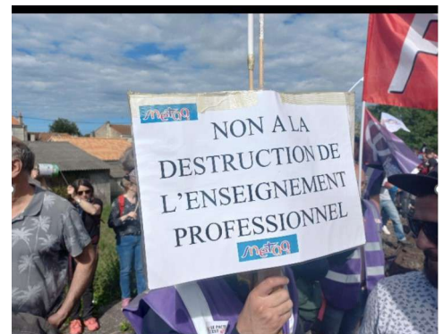
Saintes, Septembre 2023

Pour adhérer au SNETAA FO : par formulaire papier ; Par internet directement en ligne sur http://www.snetaa.org