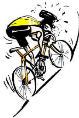
DÉCÔTE DE PLUS EN PLUS RAIDES