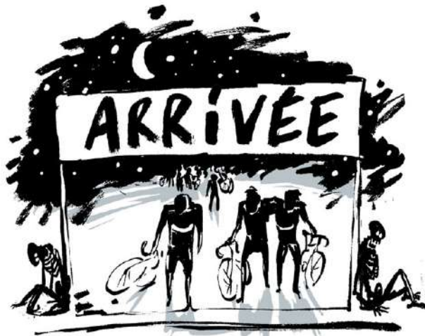
DES ÉTAPES DE PLUS EN PLUS LONGUES